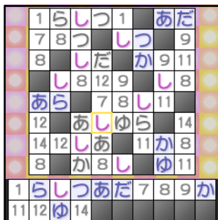
ナンナクロクロ 100 Vol.5